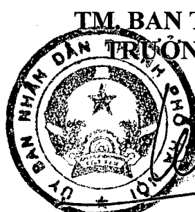
PHÓ CHỦ TỊCH UBND THÀNH PHỐ Lê Hồng Sơn

- Thông tin chi tiết về cuộc thi được đăng tải tại Trang thông tin điện tử của Hội đồng phối hợp phổ biến giáo dục pháp luật Thành phố ( https://pbgdpl.hanoi.gov.vn/ ).